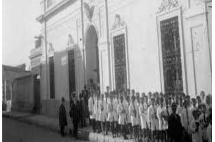
Edificio donde funcionara la Escuela Normal desde 1920