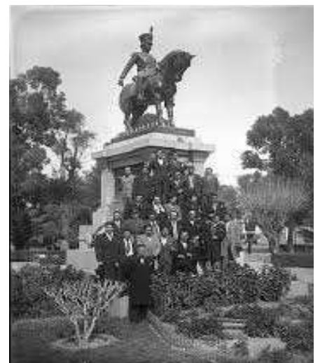
Monumento al Coronel Juan P. Pringles y la Promoción de la Escuela Normal “Juan Pascual Pringles” – 1940

En 1926, por decreto del Poder Ejecutivo Nacional, se impone a la Escuela el nombre de “Juan Pascual Pringles”, conjuntamente con los nombres de “Juan